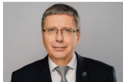
Ladislav Kos, senátor za volební obvod č.19

Jsem i pro Vás v senátní kanceláři na Praze 11, Kosmická 746, každé pondělí 14 – 18hod.